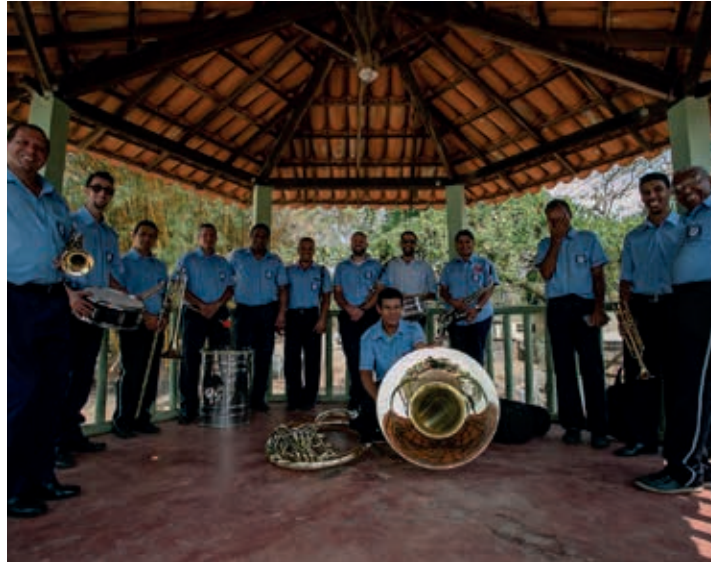
Banda civil Sociedade Musical União Social

No século XIX, grande parte das corporações musicais criadas surgiram de motivação política partidárias. E o caso da Sociedade Musical União Social que representou o partido Liberal e sua rival a