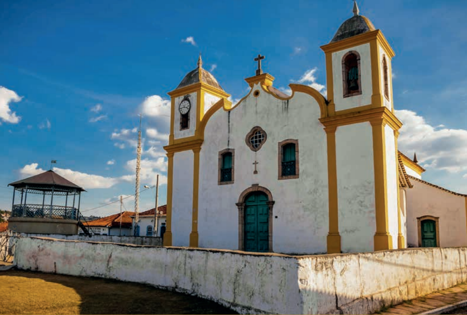
CACHOEIRA DO CAMPO