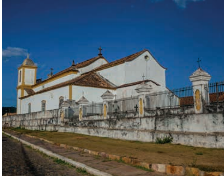
Igreja Matriz de Nossa Senhora de Nazaré

Conforme indica o historiador cônego Raimundo Trindade, a freguesia foi instituída por provisão episcopal em 1710, sendo elevada à categoria de colativa pelo alvará de 16 de fevereiro de 1724. Sabe-se que a construção da Matriz de Nossa Senhora de Nazaré data da primeira metade do século XVIII, sendo um dos mais antigos templos de Minas Gerais. A edificação é em alvenaria de pedra e apresenta partido retangular. A planta se