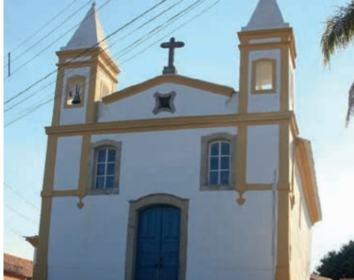
Igreja de Nossa Senhora das Dores

Não se tem documentos que informem a data precisa da construção da Capela de Nossa Senhora do Bom Despacho, localizada no distrito de Cachoeira do Campo. No entanto, em razão do modelo da edificação e do valor artístico