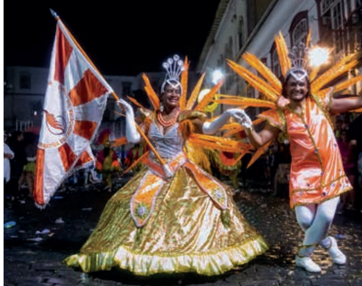
Escola de Samba União Recreativa

Segundo o fundador e presidente, a ideia de criar a Escola surgiu da experiência com o bloco da madrugada, que desfila no carnavl de Cachoeira do Campo.