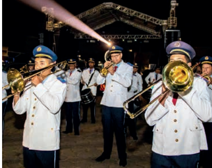
Bana Euterpe Cachoeirense

O nome “Euterpe” é uma alusão á Deusa da mitologia grega que simboliza a música. É popularmente conhecida como “Banda de Cima”, devido ao fato de Cachoeira do Campo possuir duas bandas civis e a sede ser na rua “de cima”, próximo á Matriz de Nossa Senhora de Nazaré.