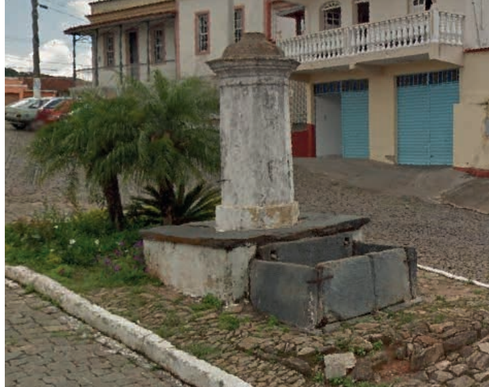
Chafariz do Padre Afonso de Lemos

A Capela de São Francisco de Paula, localizada em Cachoeira do Campo, foi construída no século XIX e em seu frontispício apresenta a data de 1877. Sofreu várias restaurações ao longo do século XX, algumas infelizmente alterando