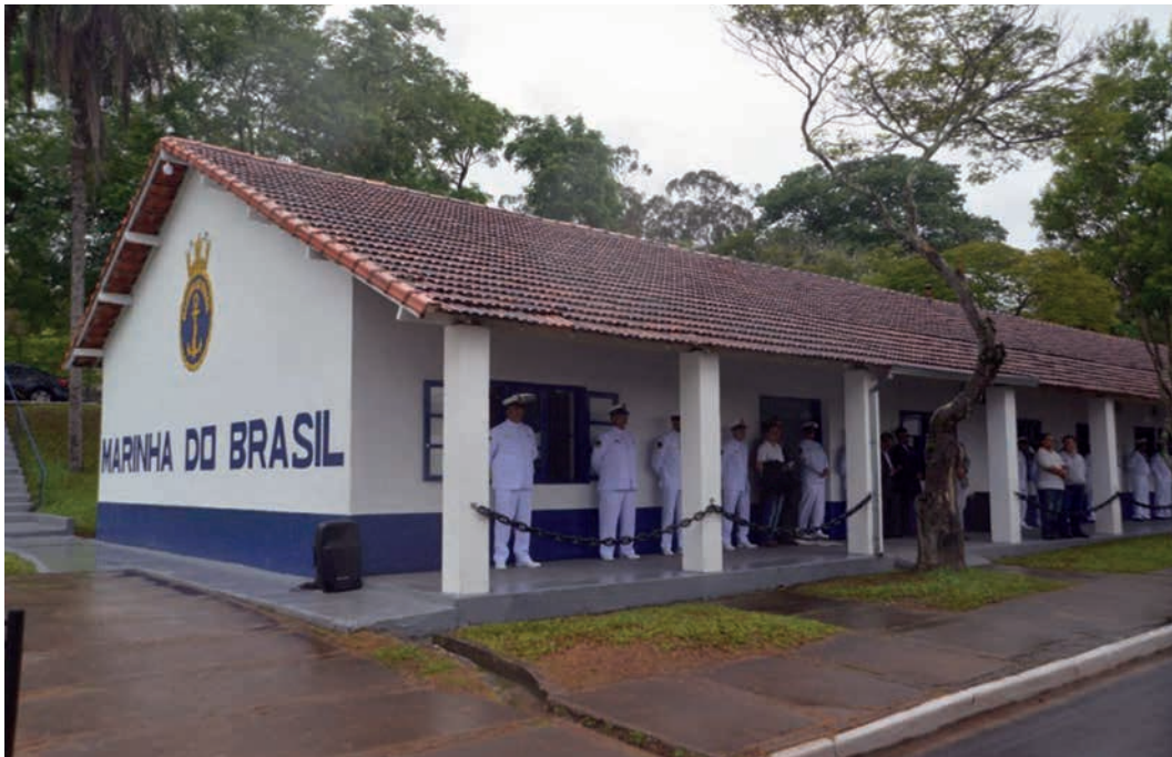
Sede da DelFurnas em São José da Barra na antiga Vila de Furnas

DelFurnas headquarters in São José da Barra in the old Vila de Furnas